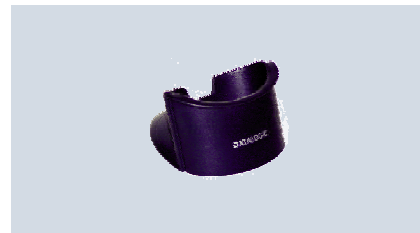
Support de table / mural

Le support de table / mural offre une grande flexibilité et facilité d'utilisation dans la plupart des environnements où l'espace est limité.