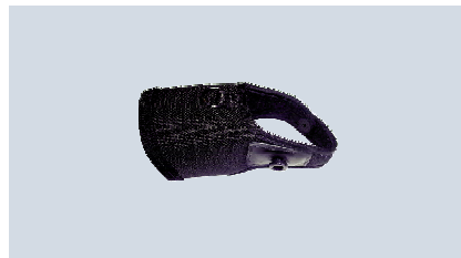
Housse de protection

La housse de protection permet de protéger le lecteur de chutes éventuelles et de l'accrocher à la ceinture lorsqu'il n'est pas utilisé.