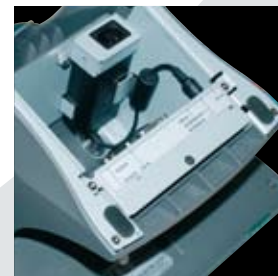
Adaptateur d'alimentation intégré